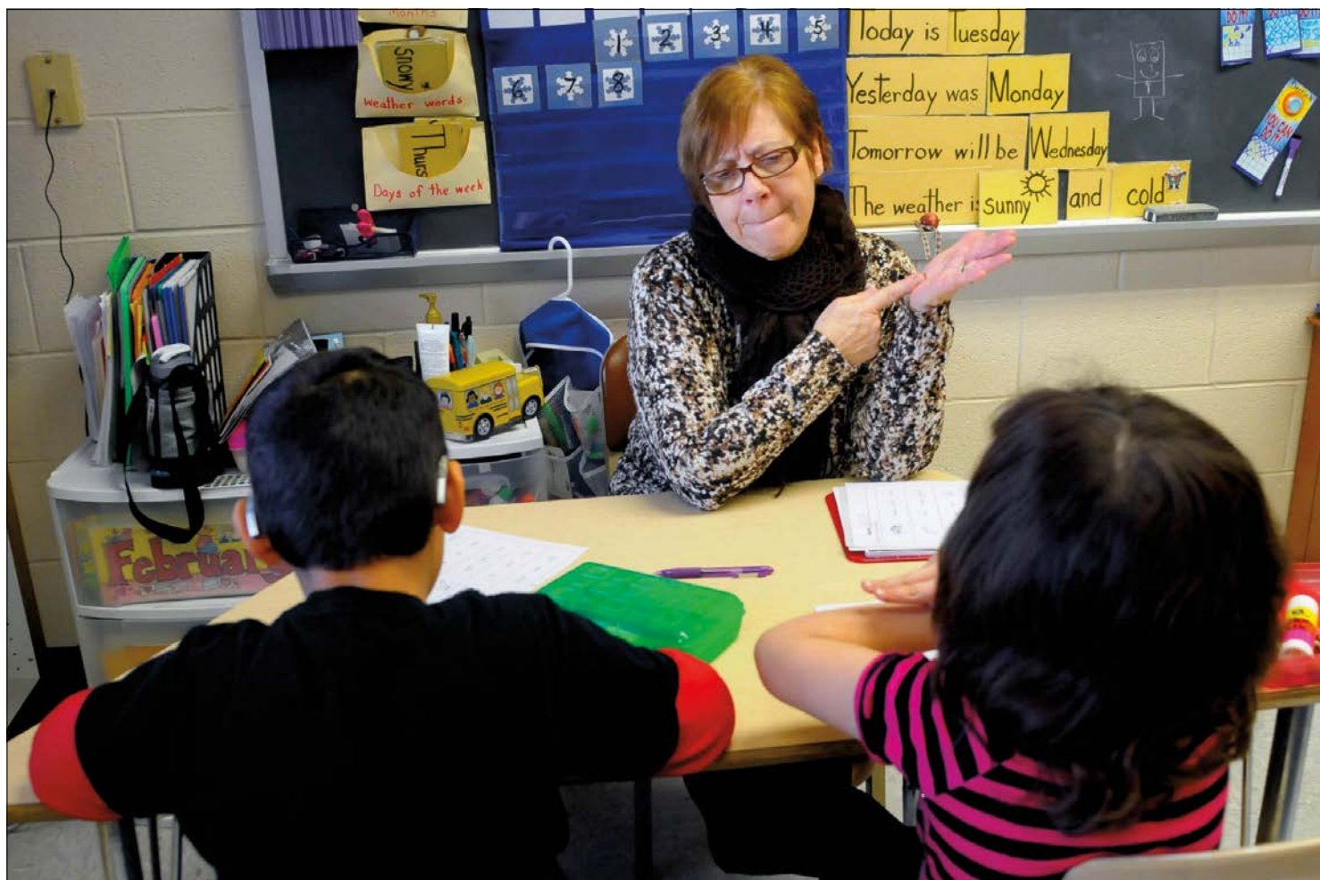
一名课堂助手使用手语向两名宾夕法尼亚州的小学生解释课堂内容。美国的学区为有需要的学生提供手语翻译、音频书籍或盲文书籍以及其他资源。

社区还可以利用已有的资源。例如，在许多地区，有些居民懂得手语，并愿意提供义务服务或者通过象征性的收费提供服务。