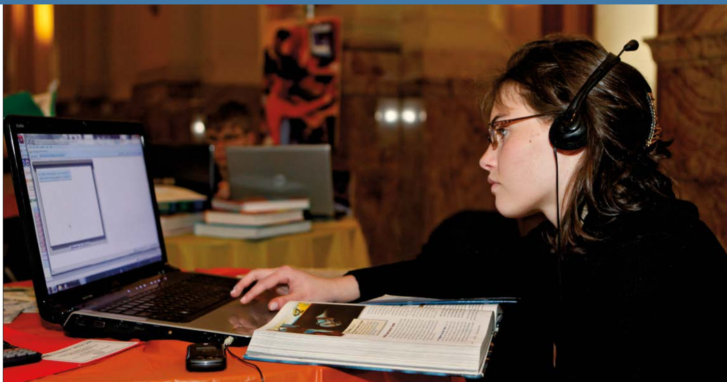
一名中学生正在学习公立在线学校提供的网上课程。在线教育资源为学生提供了不受距离、身体或经济能力限制的受教育机会。

家长可以从其他残障学生家长那里获得情感支持和实际帮助。家长们可以通过分享信息和资源为自己有残障的子女寻找和创造机会。很多社会现在都有咨询团体，他们的成员中通常有残障人士。这些团体会将残障学生的独特需求告诉学校管理者和政府，帮助他们作出更明智的决策。