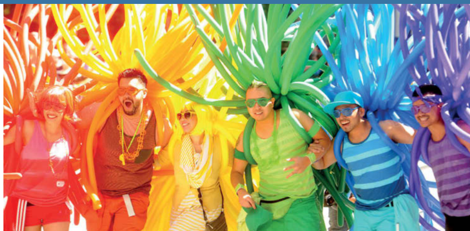
Des fêtards avec des ballons créant un arc en ciel humain lors du 42e défilé annuel de la Gay Pride à San Francisco en 2012.

l'étranger. « Nous avons également apporté de l'aide sur tous les continents à travers le monde pour créer des organisations de type PFLAG », explique M. Huckaby. Ses programmes sont axés sur le soutien aux familles, l'éducation des communautés et la promotion du changement.