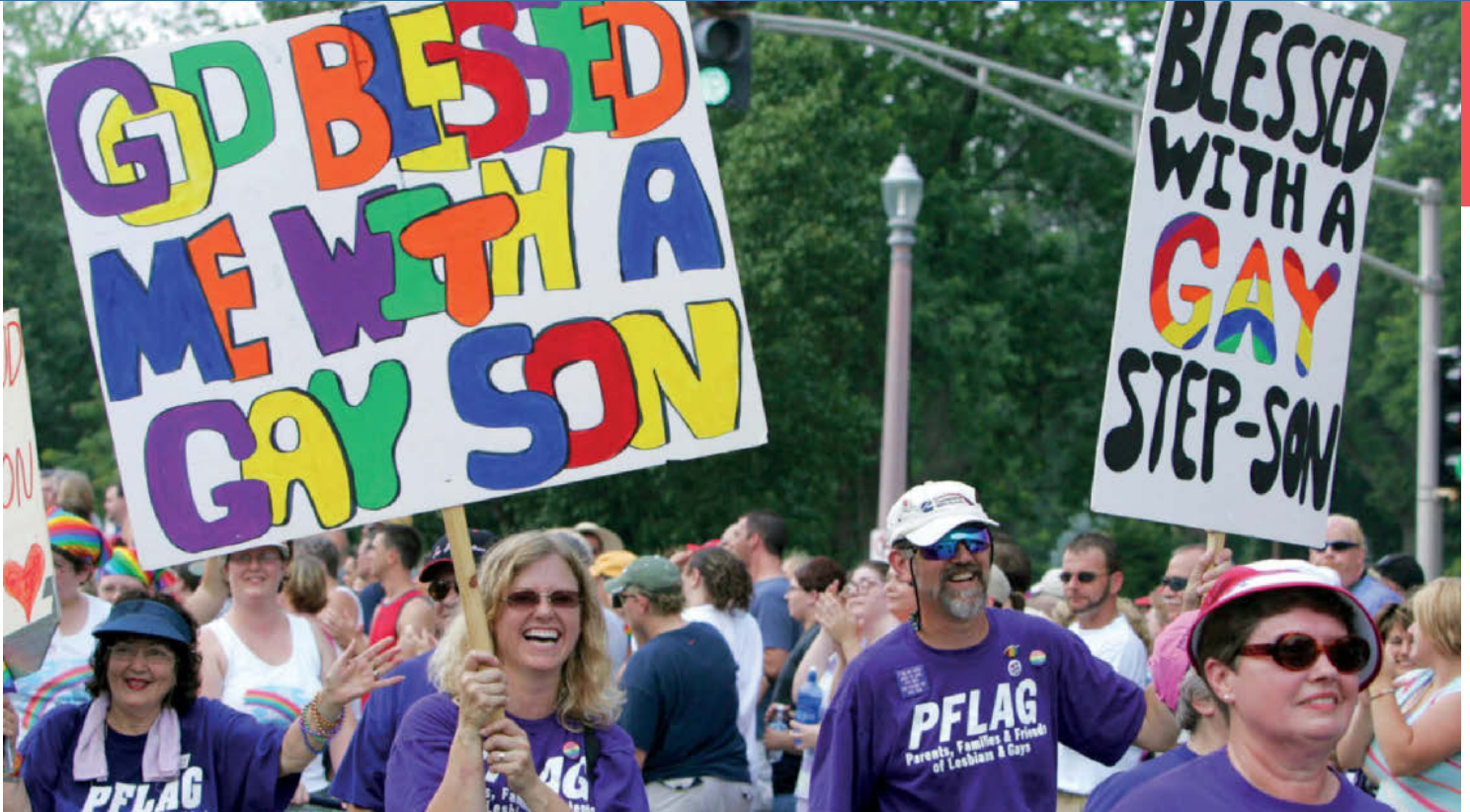
Des membres du PFLAG défilent avec leurs signes à l'occasion du défilé PrideFest de 2005 à Saint-Louis.

M algré des récents progrès juridiques et sociaux, les lesbiennes, gays, bisexuels et transgenres (LGBT) continuent de faire face à l'intolérance et à l'injustice à travers le monde. Les jeunes LGBT en particulier sont victimes de discrimination, de harcèlement et de violence dans leur communauté, à l'école et à la maison. Autrement dit, beaucoup d'entre eux vivent dans la peur.